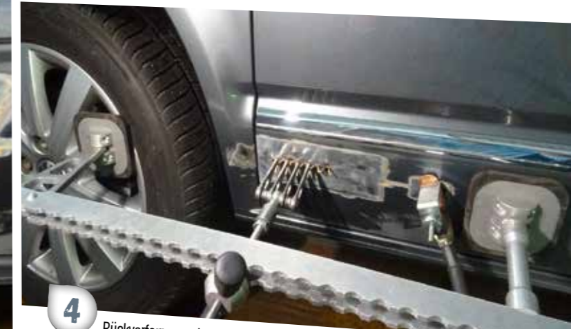
4 Rückverformung durch Zugbrücke