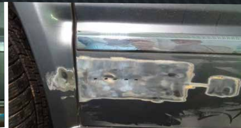
2 Lackierung der beschädigten Teile entfernt