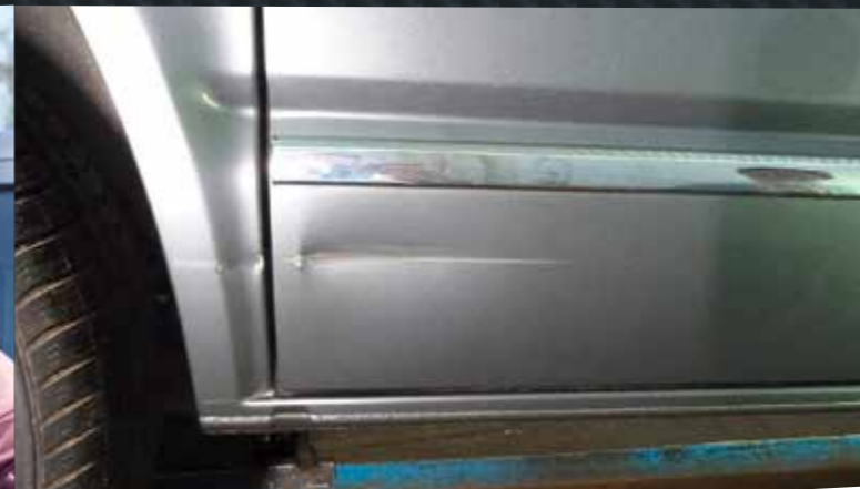
1 Aufnahme des Schadens

Die deutlich bessere Verarbeitungsqualität im Vergleich zu bislang genutzten Verfahren führt zu einer hohen Qualität des Endergebnisses – denn auch die Nachgewerke (z.B. Lackierer) profitieren.