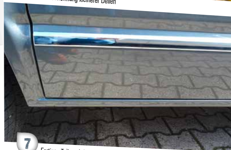
7 Fertiges Teil nach Lackierung