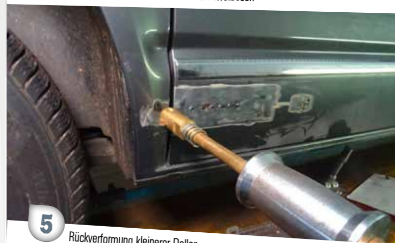
5 Rückverformung kleinerer Dellen