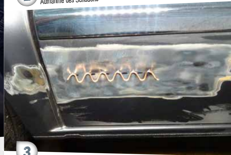
3 Punktuell Aufschiessen der Anschweißösen